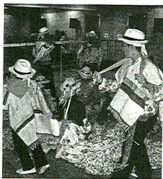
TRADICIÓN. Una de las sesiones del taller de bailes. / A.L.

Con la puesta en marcha del proyecto de los locales de ensayo para grupos de música, se dará respuesta a una demanda local que se remonta a hace más de una década.