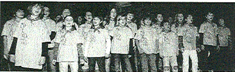
Niños de la escuela Juan Bautista Gisasola cantando por Santa Cecilia en Musikalean.

Los alumnos y profesores de la Escuela de Música Juan Bautista Gisasola de Eibar tomaron parte también en esta iniciativa y salieron ayer a la calle con los grupos de lenguaje musical, acordeones y trikitixas para deleitar a los eibarrés. ■